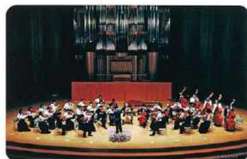
作陽弦楽合奏団演奏旅行 in 島根