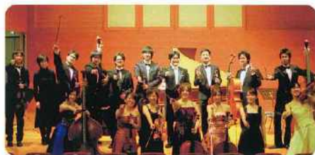
第6回作陽フェスティバルコンサート 入江洋文ヴァイオリンリサイタル