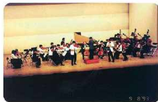
作陽弦楽合奏団演奏旅行 in 福岡

ご縁あって母校であるくらしき作陽大学に来ていただくことになりました。現在、大学自体は音楽学部・食文化学部・子ども教育学部と3学部になり、私が在籍した頃とは大きく様変わりしています。しかし音楽学部の学生を眺めると、音楽に対するひたむきさや、思い入れ、情熱といったものは当時と何ら変わらないのに気付かされます。私も音楽学部が活気に満ち溢れていた時代を知っています。学生の今も昔も変わらない気持ちを大切にしつつ、さらに活気あふれる学部になるよう努力していく所存でございます。私の力は微力ですので卒業生の皆様のご協力は必要不可欠です。いろいろとご協力していただく場面もあるかと思いますが、何卒よろしくお願い申し上げます。